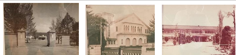
<昭和41年 正門><昭和53年 旧講堂><昭和59年 前校舍>

それから色々な変遷を経て、昭和21年(1946年)には、児童数3296名、教員数63名の巨大校になりました。昭和39年(1964年)、従来の校歌を廃止し、新しい校歌を制定し、開校記念日を6月24日にし、深谷小学校愛唱歌を作成したそうです。