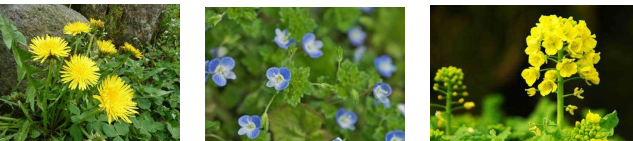
しよくぶつ① しよくぶつ② しよくぶつ③

この前学校の中を歩いていたら、「春だなあ」と思うことができました。それは、次のようなしよくぶつを見つけたからです。みなさんはこのしよくぶつの名前がわかるかな？